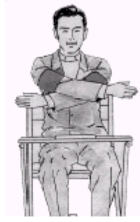
(změna stran - ZRUŠENO )