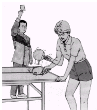
žlutá karta udělená hráči ( neopouštět židli )