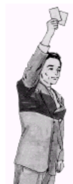
žlutá/červená karta hráči ( nevstávat )