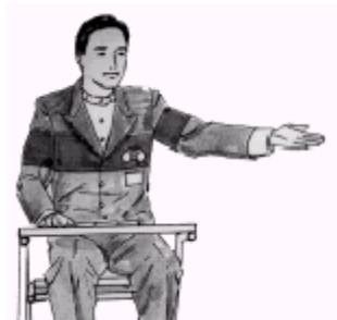
první podávající v sadě, změna podání, vítěz sady