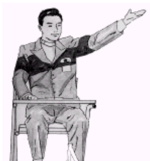
(vítěz sady - ZRUŠENO )