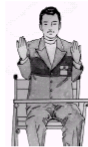
(strana stolu - ZRUŠENO )