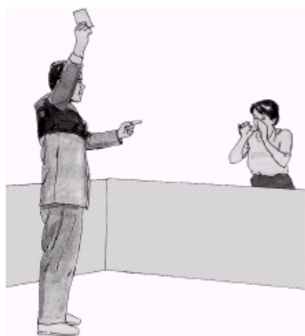
žlutá karta udělená poradci ( neopouštět židli )